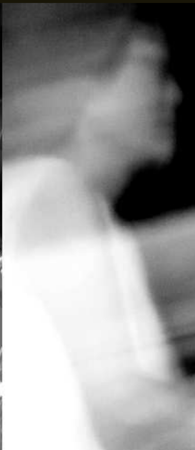
Shezoo : piano