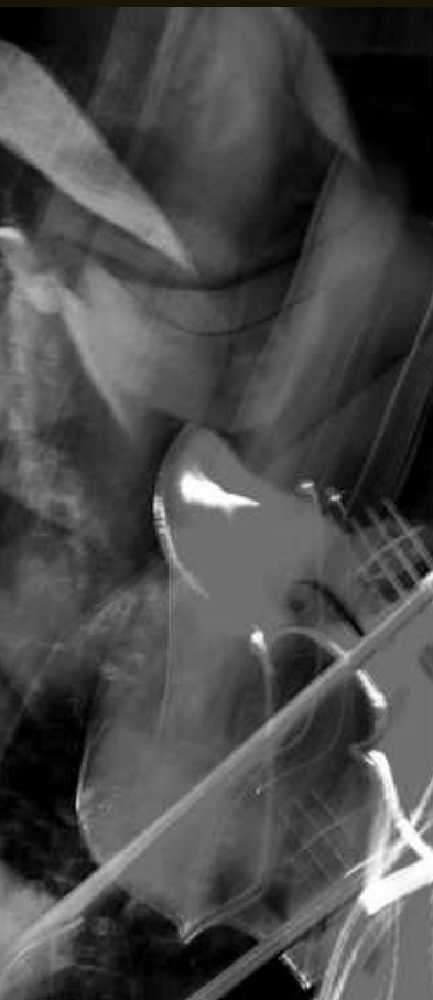
壺井彰久 : violin